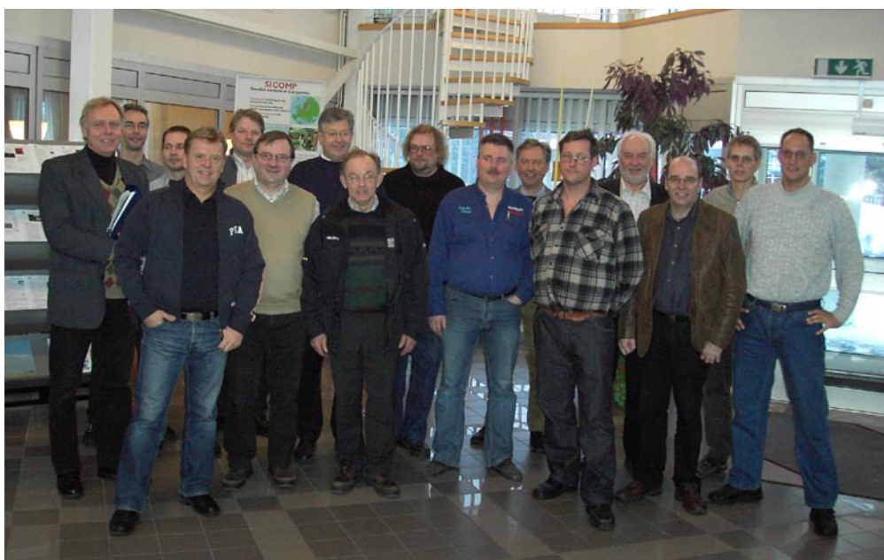
Alla företag samlade den 1/2-05 på SICOMP för kick-off möte inom projektet Norrländskt Kompositnätverk.