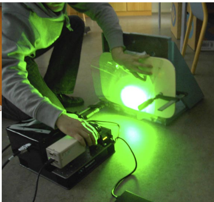
Så här kan en mätning se ut.