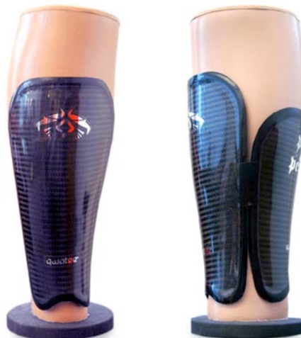
Qwatee Protector - nytt skräddarsydd benskydd som skyddar benets fram- och baksida.

Inscanning av fotbollspelarens ben vars 3D-filer används till framtagning av verktyg för tillverkning av benskyddens kompositskal.